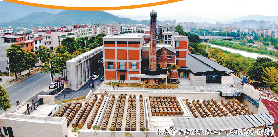
永春侨新老醋观光工厂