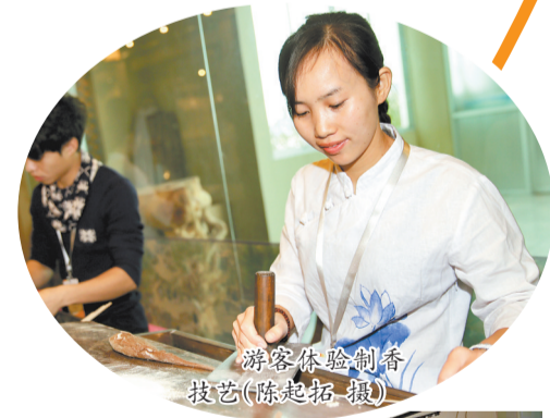
游客体验制香技艺

列。从老厂房的文化新生,到非遗技艺的活态传承,再到智能制造的硬核展示,遍布全市的特色观光工厂,正以多元业态解锁工业旅游的种种新玩法。