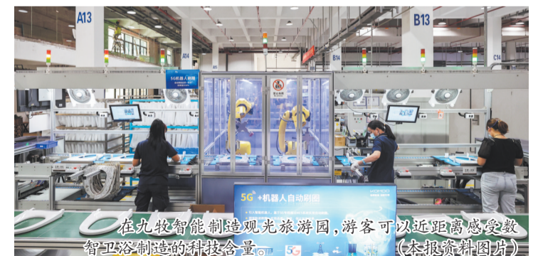
在九牧智能制造观光旅游园,游客可以近距离感受数智卫浴制造的科技含量。