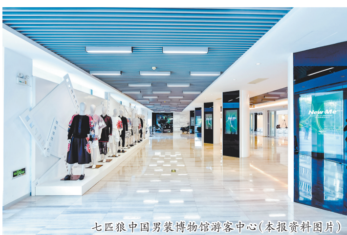
七匹狼中国男装博物馆游客中心(本报资料图片)