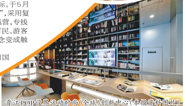
晋江POP设界运动时尚(全球)创新中心(本报资料图片)