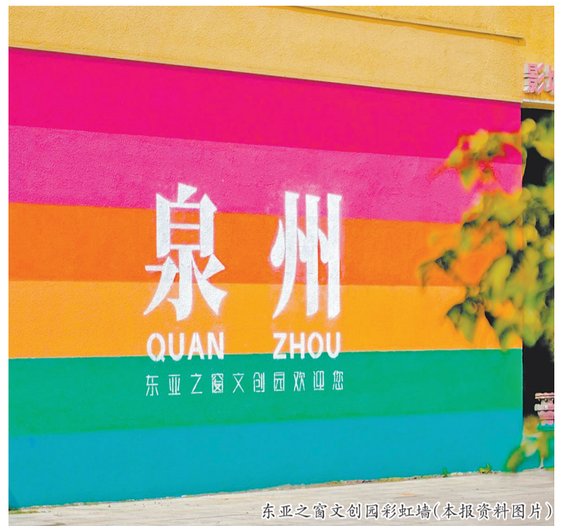
东亚之窗文创园彩虹墙

在德化,诞生于20世纪50年代的红旗瓷厂,曾是德化陶瓷工业化的象征,生产的白瓷远销海外。如今,这座老厂经过改造,变身红旗坊·文旅产业园。包豪斯风格建筑、联排厂房、红砖墙、烟囱、油罐、气窑……园区较好保留了原有的工业肌理。同时,现代艺术与潮流体验也融入其间:曾经的烧瓷器具摇身变为彰显瓷都特色的艺术装置;就连仓库里堆放的白瓷盘,也经精心排布,化作园区内独具韵味的隔断墙,与园区景观相映成趣。园区还常态化运营“羽白市集”,汇聚了大批怀揣创意的年轻人,颜值出众的白瓷杯让游客爱不释手。在选购各式陶瓷文创之余,游客还能沉浸式体验陶瓷制作的乐趣。