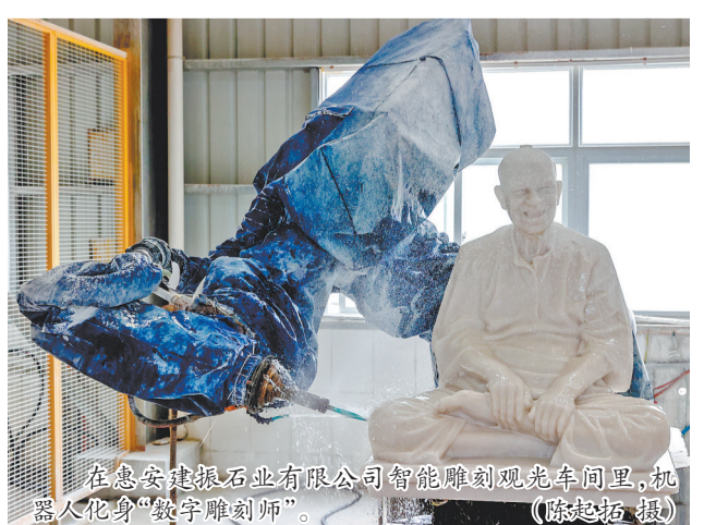
在惠安建振石业有限公司智能雕刻观光车间里,机器人化身“数字雕刻师”。