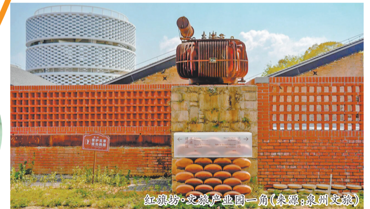
红旗坊·文旅产业园一角