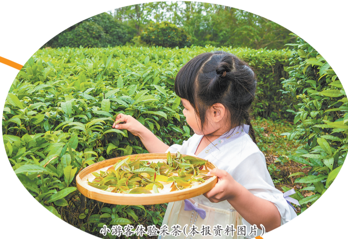
小朋友体验采茶(本报资料图片)