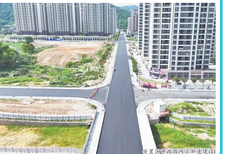
安置区市政路网正在加速建设

条次干路的沥青上面层已全部完成,DE连接线400多米管道完成80%。接下来,施工方将同步推进人行道铺装、绿化种植和交通标志牌设立,整体工程预计在两个月内全部竣工。 三标段则处于施工中期,线路总长1公里多,总投资3700万元。目前,路基土方和管线施工已完成,中桥下部结构——桩基、承台、墩柱、台帽全部完工。按照计划,6月中旬将完成中桥上部预制梁吊装,随后依次展开水稳层和沥青面层施工,全力确保今年年底整体完工。 作为安溪重点民生工程,参内安置区路网项目建成后,将有效解决安置区及周边村居出行难、排水难问题,实现片区路网与外部主干道互联互通,为移民群众打造宜居新家园夯实基础。