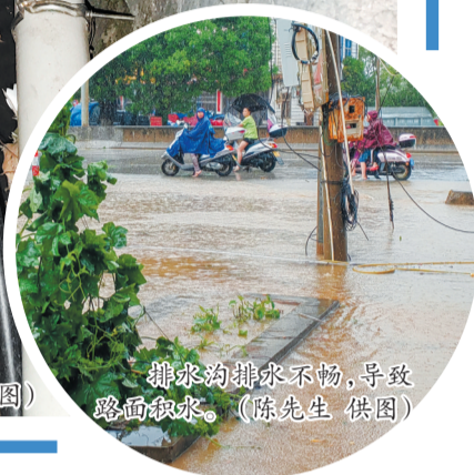
排水沟排水不畅,导致路面积水。