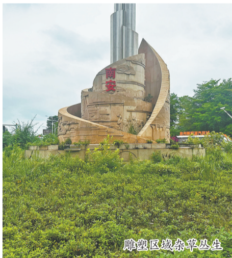
雕塑区域杂草丛生

本报讯(融媒体记者刘燕婷 通讯员陈墨 文/图)近日,市民黄先生致电96339反映,南安市江南大街靠近南环路路口的城市雕塑存在石材破损、四周杂草丛生的问题,希望有关部门尽快修缮清理,让城市标识恢复整洁。