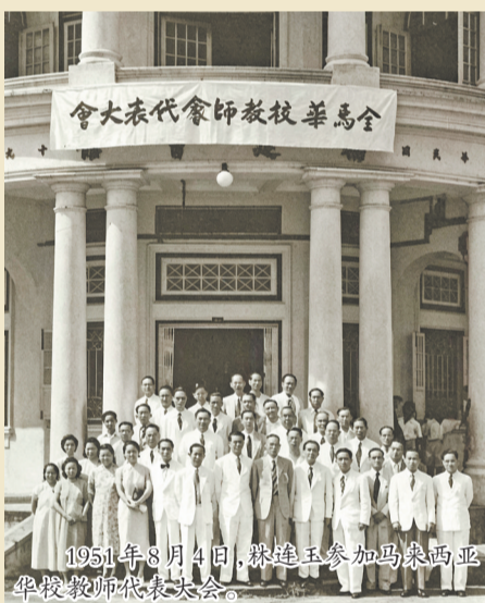
1951年8月4日，林连玉参加马来西亚华校教师代表大会

海外游子饮水思源不忘根的典型。彼时，大批旅居南洋的泉州籍侨领、教师不畏艰险，纷纷效仿隐秘私教模式开班授课，默默传承华文文脉；同时依托侨批这一跨山海的特殊纽带，跨境筹措办学经费、互通教学讲义、传递办学讯息，搭建起海内外文教联动的生命线。海内外泉州侨胞同心并肩、逆势笃行，在绝境之中守住了华文文脉生生不息的火种，才让中华母语文化未因时代动荡断绝传承。