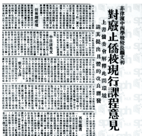
颜文初支持华文教育的报道