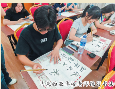
马来西亚华校老师练习书法