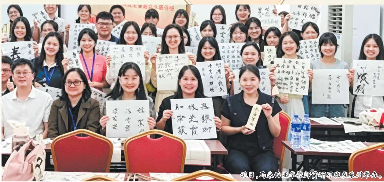
近日，马来西亚华校师资研习班在泉州举办。