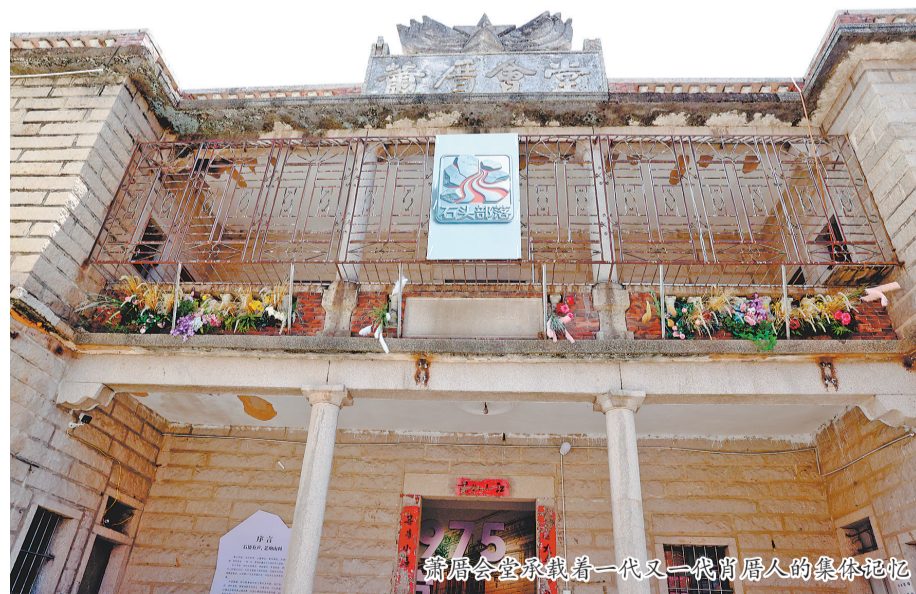
萧厝会堂承载着新一代肖厝人的集体记忆