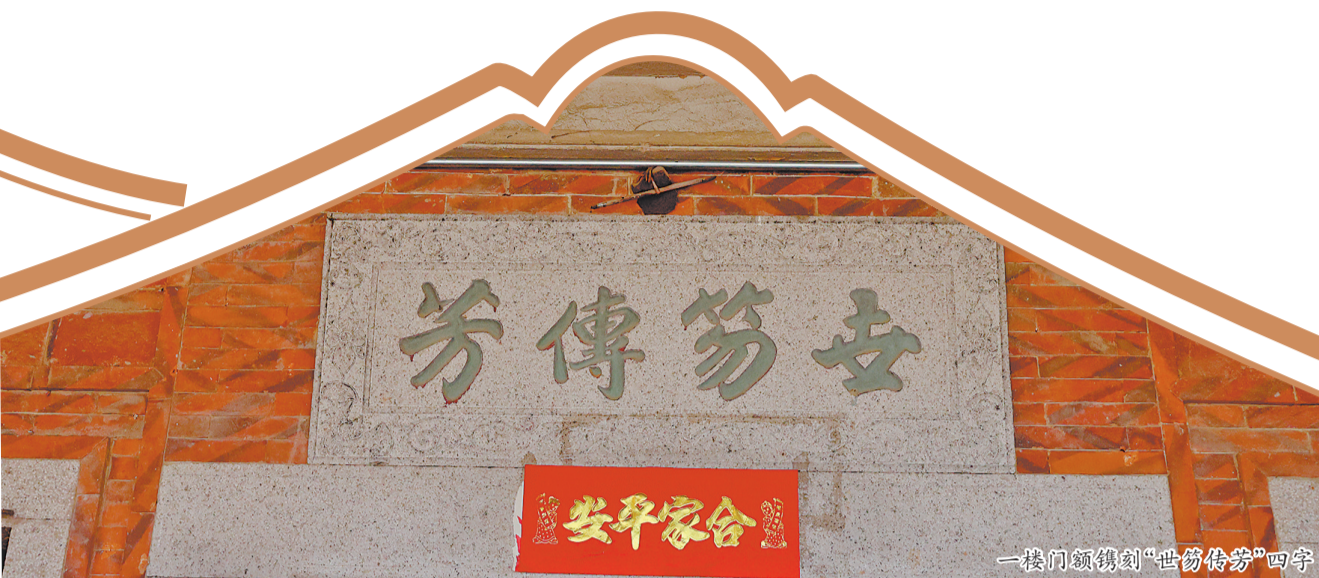
一楼门额镌刻“世笏传芳”四字