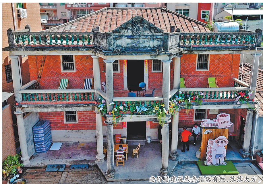
老侨厝建筑线条错落有致，落落大方。