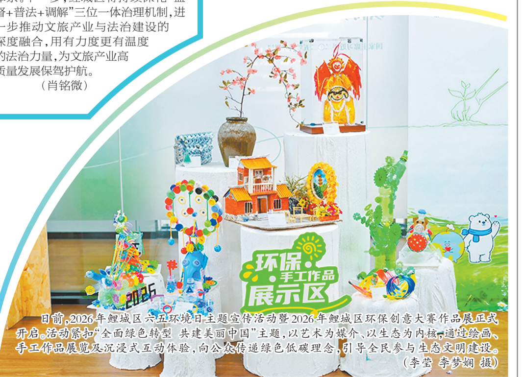
日前,2026年鲤城区六五环境日主题宣传活动暨2026年鲤城区环保创意大赛作品展正式开幕。活动紧扣“全面绿色转型 共建美丽中国”主题,以艺术为媒介,以生态为内核,通过绘画、手工作品展览及沉浸式互动体验,向公众传递绿色低碳理念,引导全民参与生态文明建设。

活动。 一套太极,练的是身体,通的是智慧,达的是品格,这正是泉州市新村小学“融通”办学理念的生动具象化。近年来,该校坚持将非物质文化遗产传承融入学校教育全过程,推动非遗从“进校园”向“进校园”转变,逐步形成“非遗+N”活态传承模式。目前,学校已先后引进太极拳、螳螂拳、竹竿舞、跳皮筋等项目,“非遗+体育”融合育人也成为学校的一张特色名片。(黄凯杰 李梦娴)