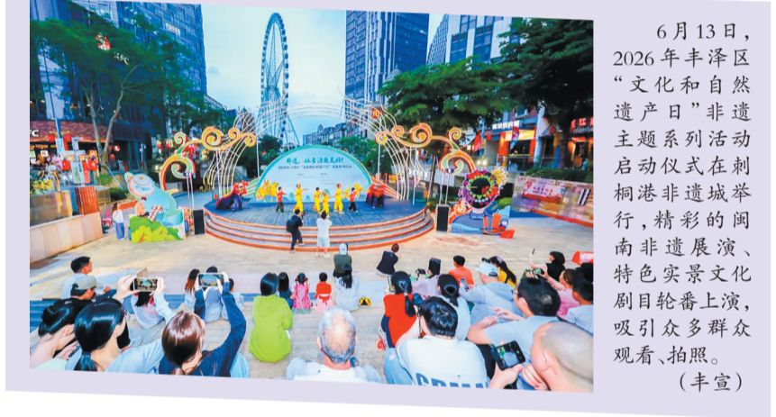
6月13日,2026年丰泽区“文化和自然遗产日”非遗主题系列活动启动仪式在刺桐港非遗城举行,精彩的闽南非遗展演、特色实景文化剧目轮番上演,吸引众多群众观看、拍照。(丰宣)