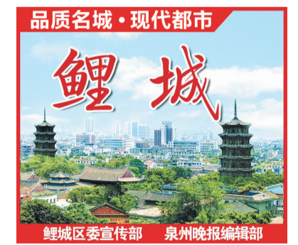
品质名城·现代都市 鲤城 鲤城区委宣传部 泉州晚报编辑部

从被动应对到主动治理,鲤城区正逐步构建起全链条的文旅法治服务体系。下一步,鲤城区将持续深化“监督+普法+调解”三位一体治理机制,进一步推动文旅产业与法治建设的深度融合,用有力度更有温度的法治力量,为文旅产业高质量发展保驾护航。(肖铭微)