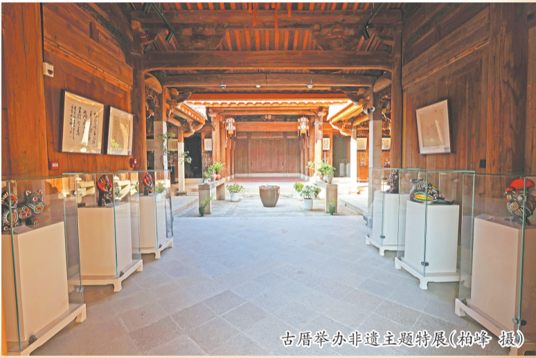
古厝举办非遗主题特展