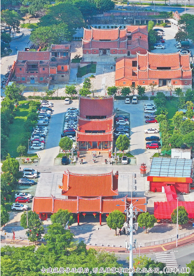
古建筑整体迁移后,形成错落有致的文化公园。