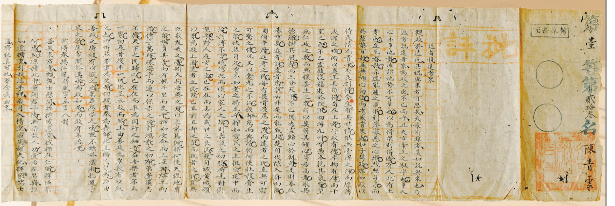
梅峰书院学子参加永春州童试的试卷

此外,文人名士留下的著作也成为研究永春古代社会经济文化的重要史料。盛均所著的《桃林场记》,是永春现有最早的地方文献,收录于清乾隆二十二年(1757)知州杜昌丁编纂的《永春州志》中。