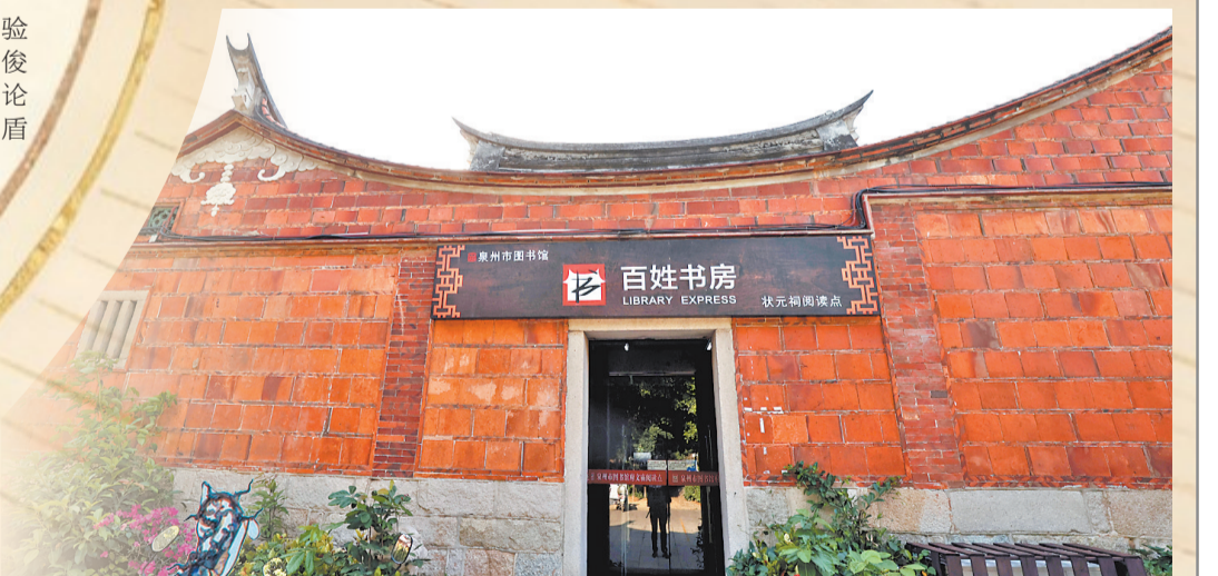
庄际昌状元祠活化利用成为“百姓书房”