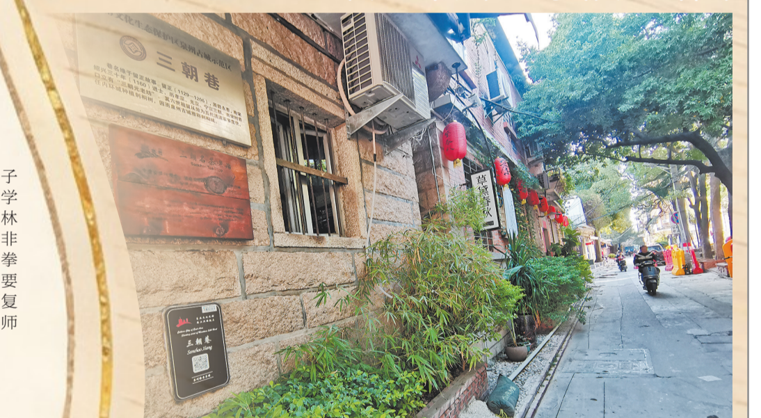
泉州市区三朝巷因“三朝元老”留正而得名(本报资料图片)

地滋养着一代又一代永春人。为核试验事业燃尽一生的中国工程院院士林俊德,祖籍永春的著名诗人、散文家、评论家、翻译家余光中先生……从为国铸盾的院士、落笔生花的文人,到如今活跃在各行各业的年轻建设者,深厚文脉从来不是停留在史书记载里的符号,而是刻进当地人骨血里的精神基因,推着每个人在各自的领域里发光,也让文化传承始终保有鲜活的生命力。