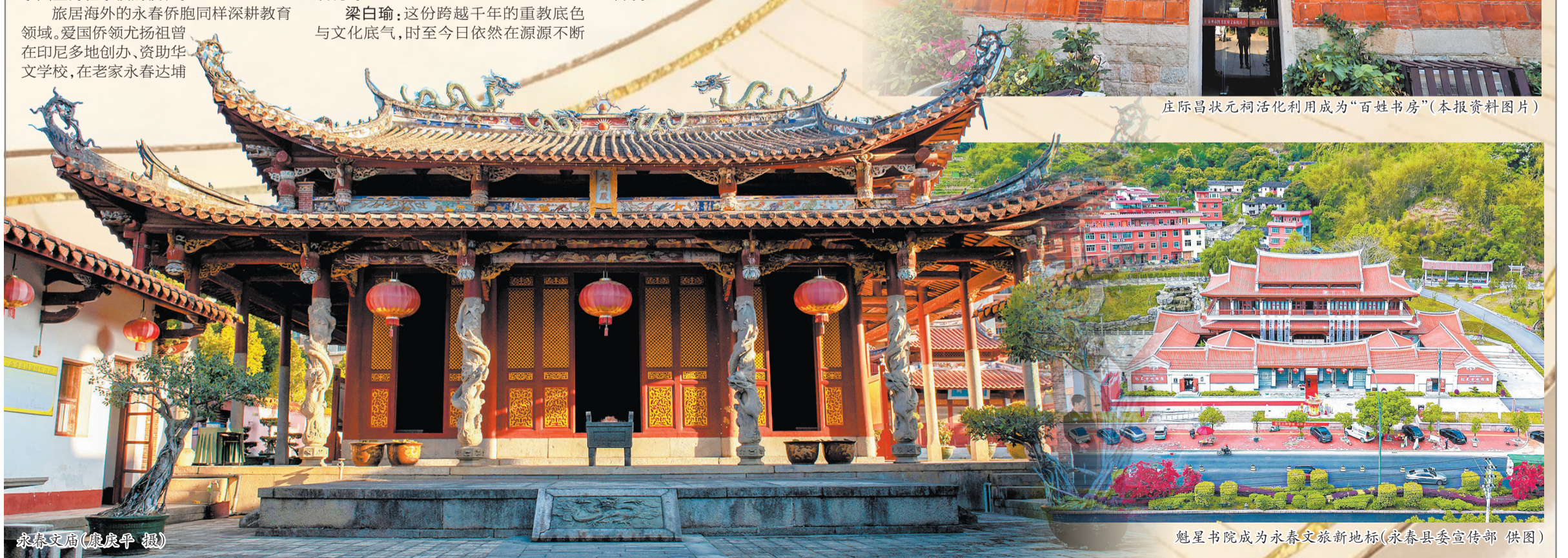
永春文庙