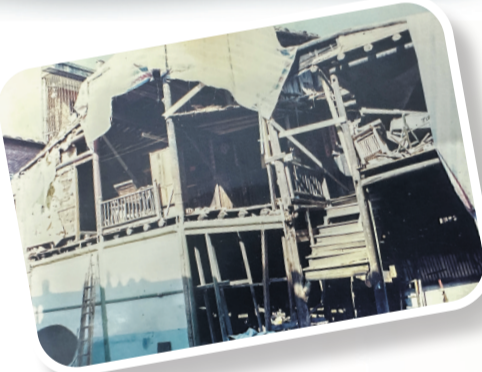
这张摄于20世纪90年代的照片,是小巷居民对二层木构瑞兴旅社最后的记忆。