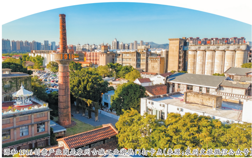
福和1916创意产业园是泉州古城工业游热门打卡点

以往工业旅游仅由文旅部门或工信部门单一推进的不足,形成了跨部委、跨行业的协同机制。八大重点任务涵盖了从遗产保护到文化挖掘,再到旅游提质的全链条。政策不仅强调了对工业遗产的“活化利用”,更明确了财政、土地、税收等方面的支持方向。这种制度红利将直接转化为投资信心,吸引更多社会资本进入工业旅游赛道。