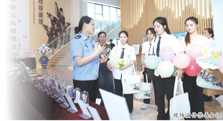
现场宣传禁毒知识

现场互动体验区人头攒动、氛围热烈。禁毒游园会以趣味问答、益智游戏让群众轻松学知识、辨毒品;非遗漆画体验将本土传统文化与禁毒理念相融,以画传戒;禁毒帆布包DIY涂鸦吸引大小朋友尽情创作,让禁毒标语牢记于心;吸毒危害模拟体验更是带来直观震撼。沉浸式展区动静结合、寓教于乐,让群众在体验中筑牢内心防毒防线。