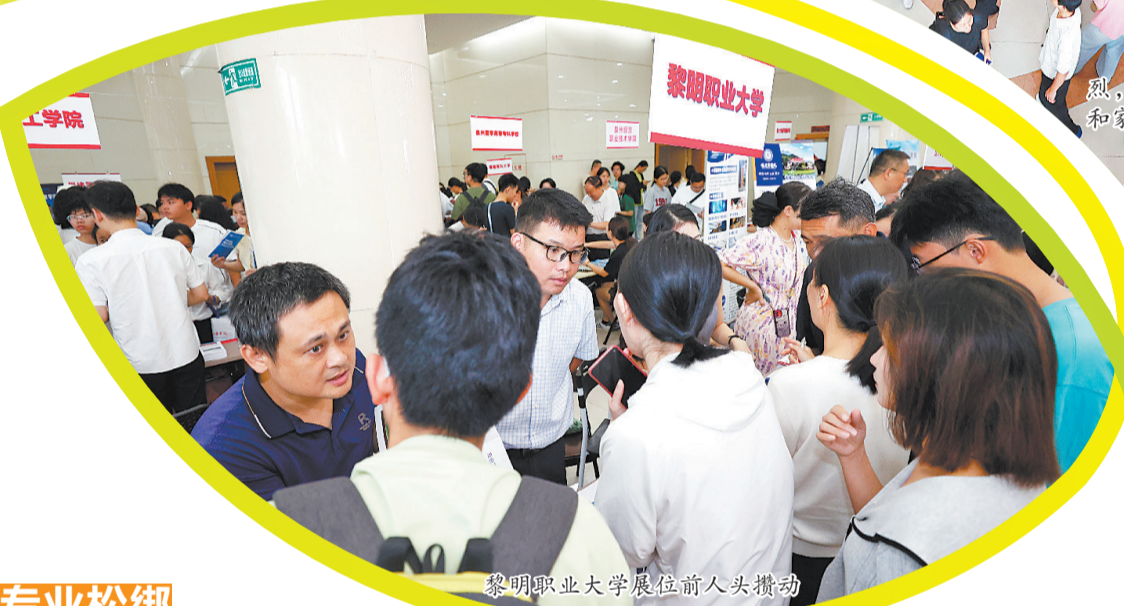
黎明职业大学展位前人头攒动