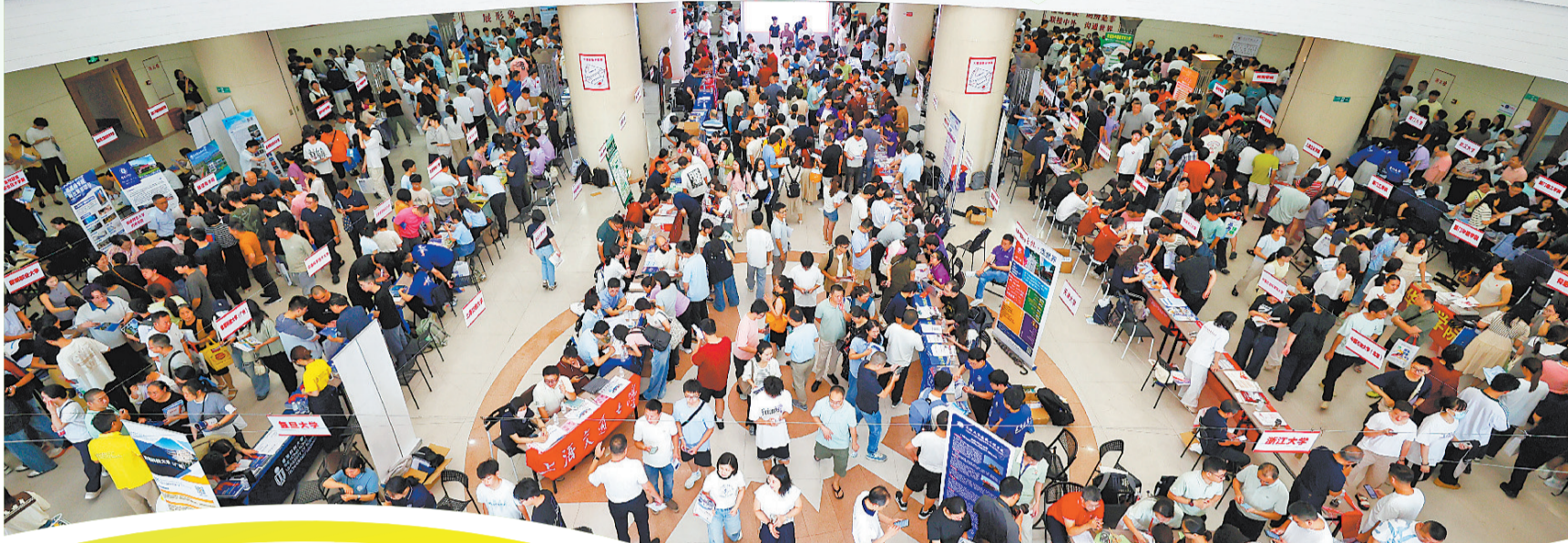
咨询现场气氛热烈,前来咨询的考生和家长络绎不绝。