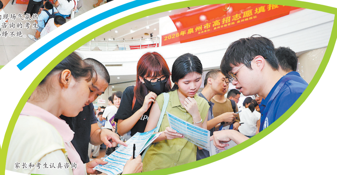
家长和考生认真咨询