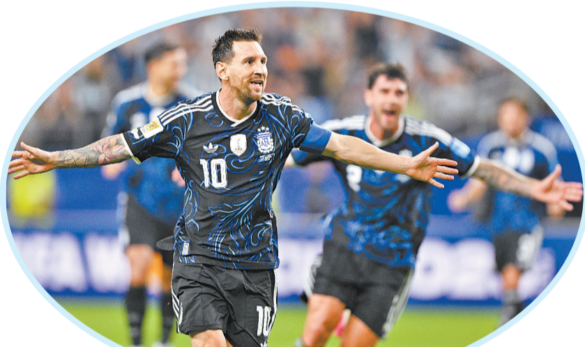
6月27日,阿根廷队球员梅西庆祝进球。

另外,L组末轮,英格兰队2:0击败巴拿马队,两胜一平积7分,以小组头名出线。克罗地亚队2:1战胜加纳队,两队并列小组二、三名,均获得淘汰赛席位。