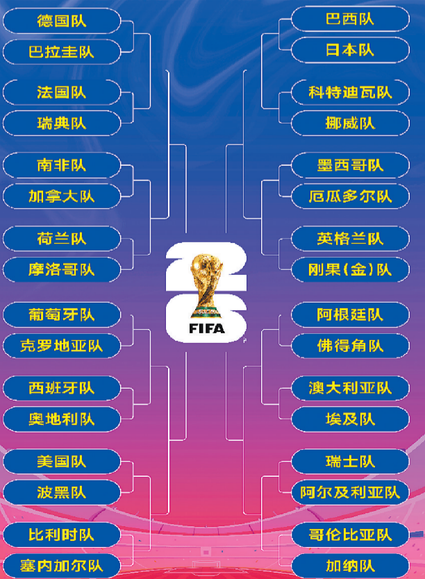
新华社(宋) 美加墨世界杯淘汰赛首轮对阵情况(新华社)