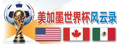
美加墨世界杯风云录

这是世界杯历史上首次迎来32强淘汰赛。更刺激、更残酷的世界杯,也许现在才刚刚开始。