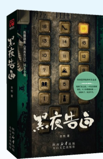
言忱 著 太白文艺出版社

有些案子会被放进档案柜尘封,但不会被遗忘。《黑夜告白》不只是一个悬案故事,它讲述一场延续三代人的真相接力,以及人们如何纪念深爱的人、坚守不灭的信念。同名热播剧由潘粤明、王鹤棣主演,剧中未说尽的故事,将在书中完整呈现。多线叙事横跨十余年,案件扑朔迷离,悬念迭起;跨代警察联手查案,人物情感与案件紧密交织,未解的执念让真相愈发沉重,故事层层反转,引人入胜。