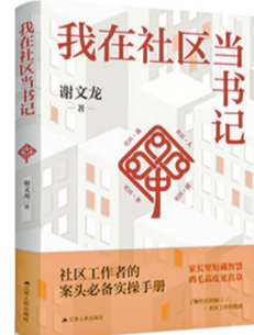
《我在社区当书记》 谢文龙 著 江苏人民出版社

社区方寸虽小,自有千钧担当。这份担当从不是墙上空洞的标语,藏在朝暮往复的寻常日子里,藏在每一位把群众难处当作自家事的基层工作者身上。他们身上的微光足以抚平烦恼,温暖一城人心。