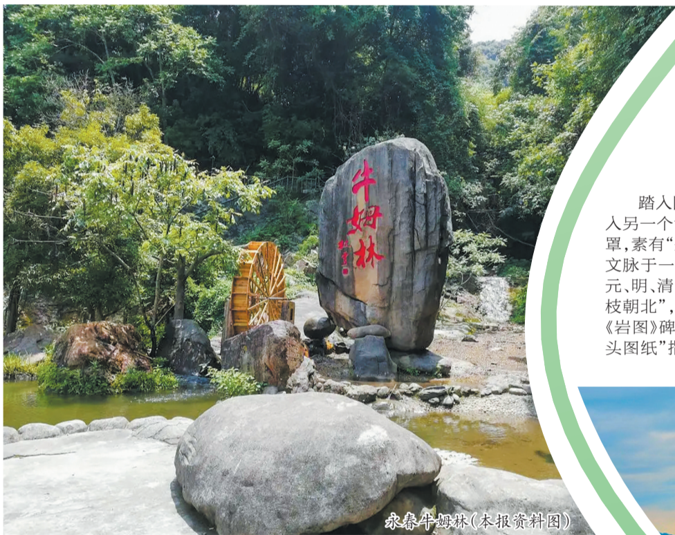
永春牛姆林

高速路线： 从泉南高速永春出口驶出，沿省道行驶约40公里可达。自驾路况良好，沿途可见茶园梯田风光。 停车与充电： 景区门口设有大型停车场，配备新能源充电桩。建议上午9点前抵达，避开团队高峰。