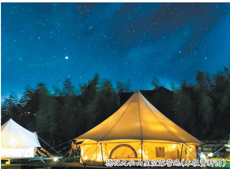
德化石牛山星空营地

停车与充电： 九仙山服务区已配备快充桩，上山前建议补足电量。海拔升高时，电车续航力会打折，预留电量更安心。