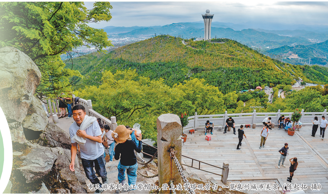
市民游客到晋江紫帽山，登上凌霄塔观景台，一览泉州城市美景。