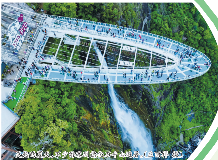
炎热的夏天，不少游客到德化石牛山避暑。