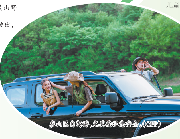
在山区自驾游，尤其要注意安全。(CRP)

肉、溪鱼豆腐汤等石牛山农家菜，满足山野本味。 高速路线： 从沙厦高速德化出口驶出，沿国道355线往水口镇方向，行驶约40公里。部分路段为盘山公路，建议白天行驶，注意落石标志。 安全提示： 瀑布区域地面而湿滑，请穿防滑鞋；漂流时，务必穿好救生衣，要做好手机、相机的防水。