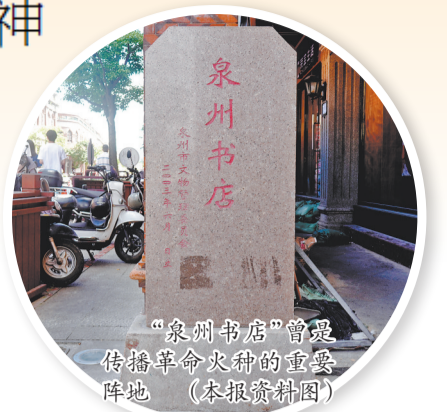
“泉州书店”曾建 传播革命火种的重要 阵地 (本报资料图)