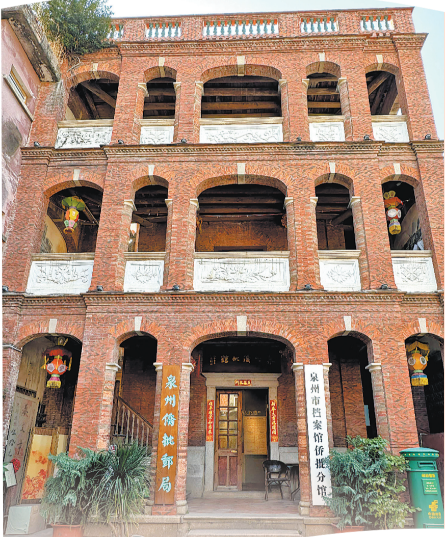
泉州侨批馆

泉州城区内,泉州侨批馆、鲤城侨批馆、泉州王宫侨批展示馆等特色侨批馆,以“一纸侨批”为载体,留存最细腻、最真挚的侨胞赤子心跳。