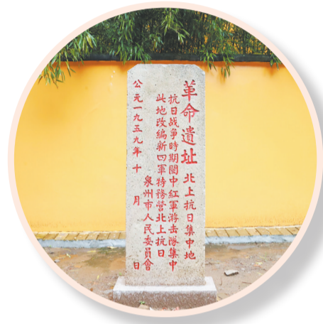
碑文背后,是惊心动魄的“泉州事件”。

府文庙东侧的明伦堂,同样是古城不可错过的遗址碑点。作为古代泉州最高学府核心空间,这里历来是士子研习儒学、传扬道德之地,明伦堂大门左前方竖立石碑,鲜红字体镌刻“中共泉州特别支部所在地”。1927年1月,中共泉州特别支部在此正式成立,隶属中共闽南部(特)委领导,负责指导泉属各县党组织工作,刺桐大地的革命星火自此点燃。时至今日,走进明伦堂,既能品读欧阳詹、曾公亮、吴鲁等历代状元名臣书写的绵长文脉,亦可循着碑刻回望泉州党组织萌芽起步的峥嵘开端。