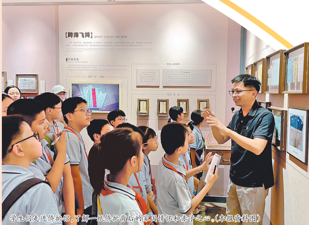
学生们走进侨批馆,了解一纸侨批背后的家国情怀和赤子之心。(本报资料图)