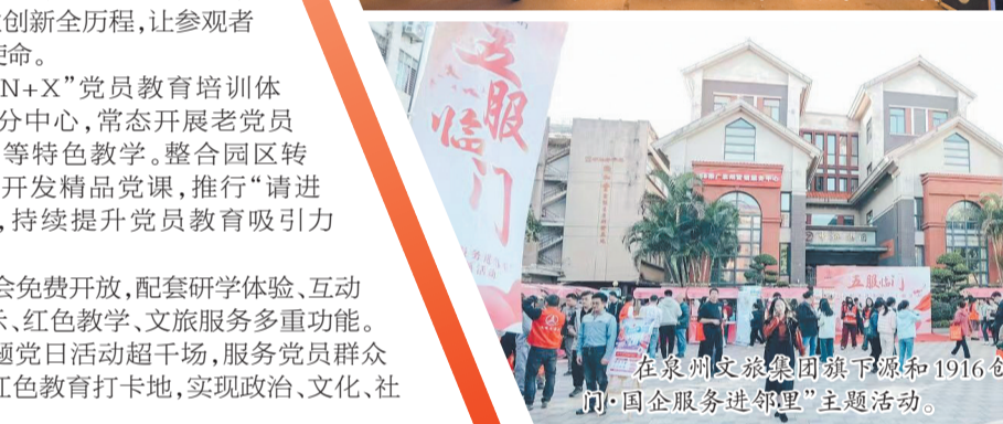
在泉州文旅集团旗下源和1916创意产业园举办的“五服临门·国企服务进邻里”主题活动