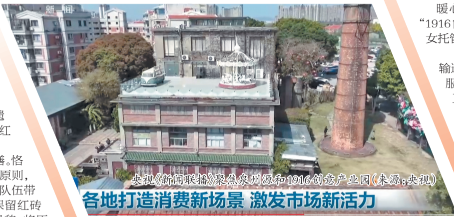
央视《新闻联播》聚焦泉州源和1916创意产业园

园区展馆面向社会免费开放,配套研学体验、互动打卡区域,兼顾工业展示、红色教学、文旅服务多重功能。开馆至今,承接各地主题党日超千场,服务党员群众10万余人次,成为知名红色教育打卡地,实现政治、文化、社会效益协同统一。