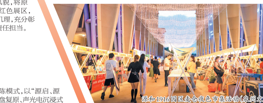
源和1916园区夜仓夜市市集活动