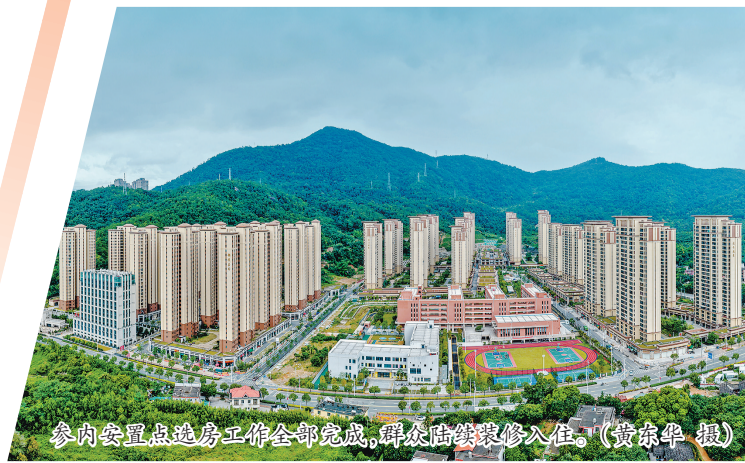
参内安置点选房工作全部完成,群众陆续装修入住。

聚焦移民长远生计,支部联动多部门在安置区开展技能培训,开设种植养殖、家政服务课程;对接周边产业园、集镇商铺提供就业岗位,鼓励就近务工;同步落实耕地指标调剂、农田配套改造,保障务农移民生产用地。针对高龄老人、低保家庭、残疾人等群体,落实专项补助、暖心帮扶政策,兜底保障基本生活。