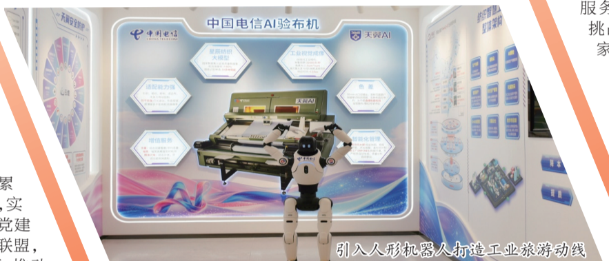
引入人形机器人打造工业旅游动线

规划、落地全流程服务,让不同规模的企业都能找到适合自己的转型路径。 通过“一企一策、精准服务”,全市累计打造500余个工业数字化标杆项目,实现重点产业集群全覆盖。同时,深化“党建翼联”共建,加入全市大数据产业党建联盟,联动181家产业链上下游党组织资源,推动标杆项目相继落地。