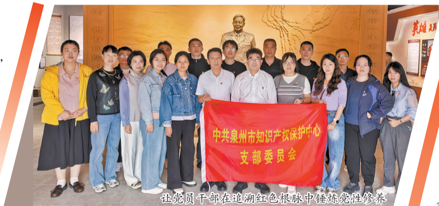
让党员干部在追溯红色根脉中锤炼党性修养

建强骨干队伍,提升组织凝聚力。持续完善人才培养体系,常态化开展知识产权专题培训、业务研讨、调研走访,建设14家专利预审实践基地,打造“干部讲坛”交流平台,实施“导师帮带”培养模式,持续提升队伍综合能力,多名干部入选省、市法院技术调查官,1名党员获评“全国模范人民调解员”、2名党员获评省级市场监管、知识产权先进个人。