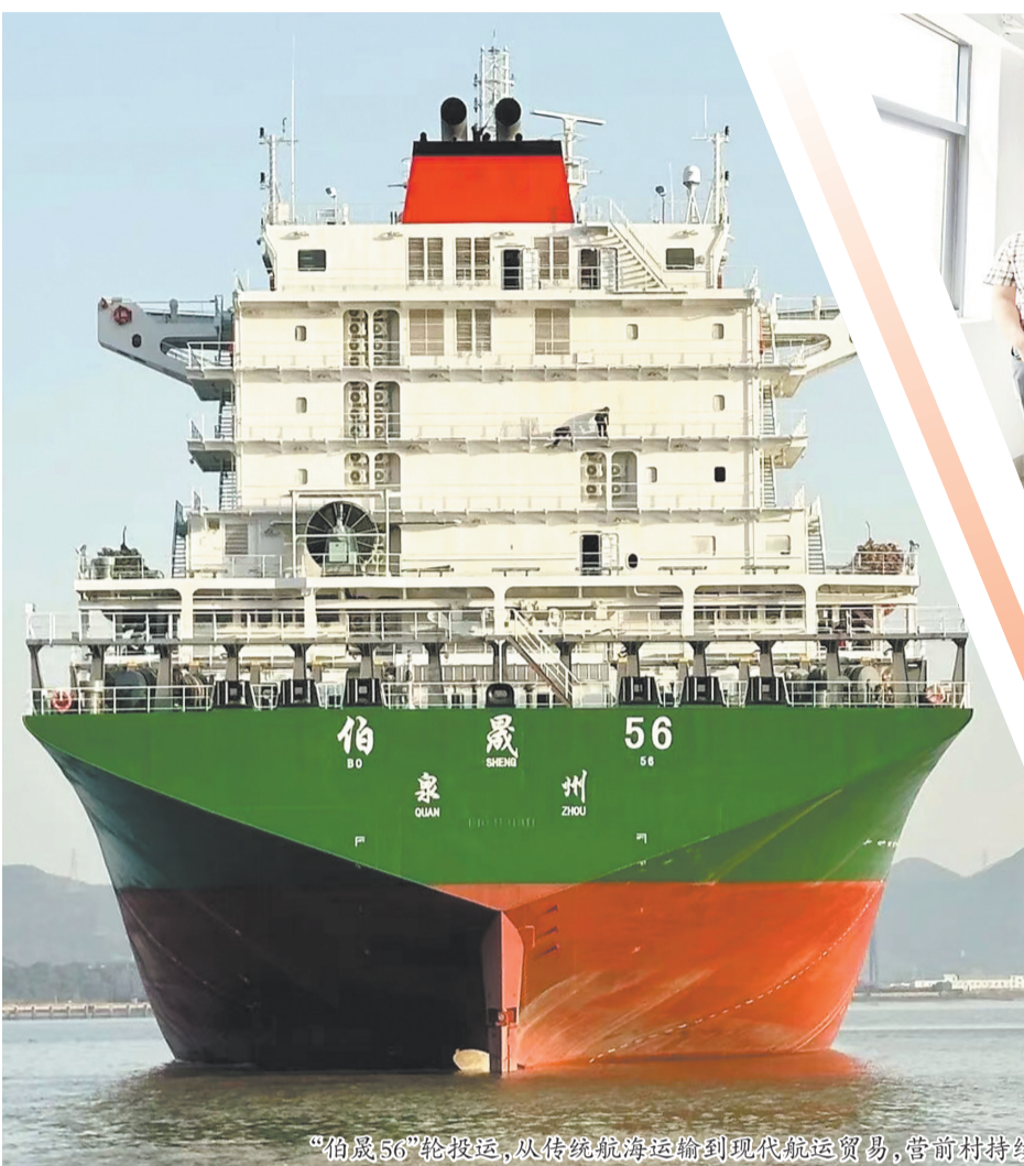
“伯晨56”轮投运,从传统航海运输到现代航运贸易,营前村持续向海图强。

从全省首个红色船员党支部,到全省首个村级船员劳动争议调解中心,营前村不仅把产业做大了,更把党建做实了,把服务做细了。一座航运史馆存续记忆,一个红色支部凝聚人心,一间调解中心守护公平——串起的正是一个渔村从产业兴起到治理升级的完整逻辑。记者近日走进营前村,从这三处坐标出发,探寻这座“中国航运第一村”的蝶变密码。□融媒体记者 黄文珍