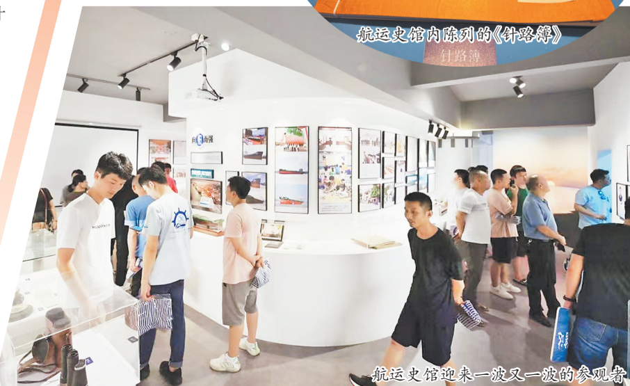
航运史馆迎来一波又一波的参观者