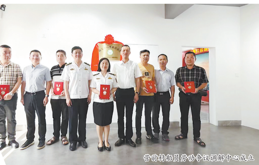
营前村船员劳动争议调解中心成立