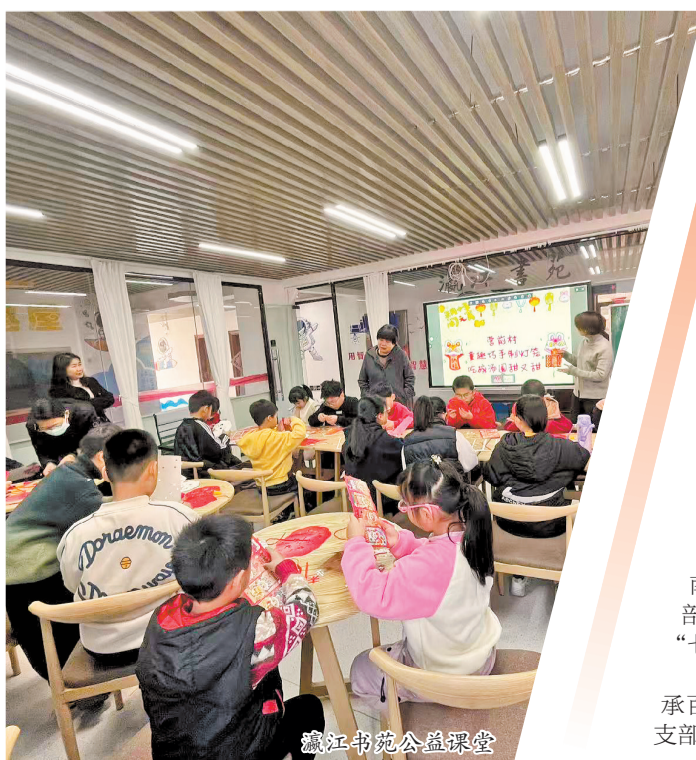
藏江书苑公益课堂

从破解流动党员管理难题,到打造航运服务新生态,从传承百年航运文化,到赋能产业高质量发展,营前村红色船员党支部生动诠释了“支部建在产业链上”的现代内涵。