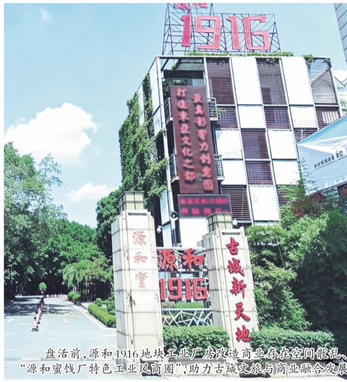
盘活后,源和1916地块工业厂房改造商业存在空间散乱、业态闲置、停车不足等问题;盘活后,地块转型为商务金融、零售商业、餐饮等多元功能混合的“源和蜜钱厂特色工业风商圈”,助力古城文脉与商业融合发展。