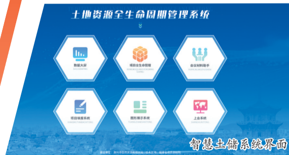
智慧土储系统界面

潮涌东海千帆竞,守脉拓土再出发。下一步,泉州市自然资源和规划局将持续发挥规划引领和要素保障作用,持续深化全国低效用地试点改革,迭代完善古城土地盘活政策体系;泉州市土地储备中心将强化党建引领,深耕古城文脉守护、存量用地盘活、用地保障等主责主业,精耕每一寸国土空间,释放土地最大综合价值,为泉州建设世遗典范城市、推动经济社会高质量发展蓄势赋能。