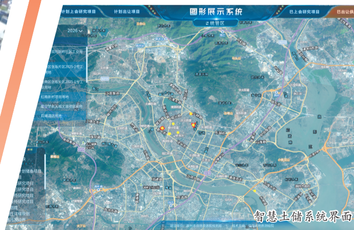
智慧土储系统界面