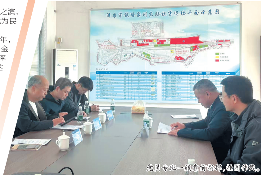
党员专班一线靠前指挥,绘图作战