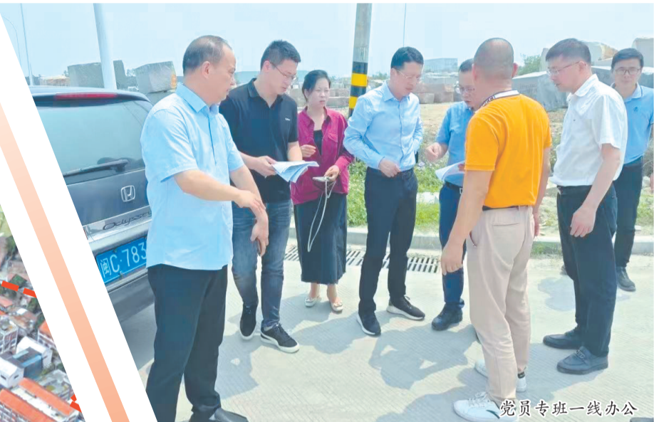
党员专班一线办公

这样的案例并不鲜见。据统计,目前中心城区储备地块改造提升为口袋公园7处、新增停车场1000余个车位,让市民推窗见绿、出门进园,有效改善了人居环境品质。