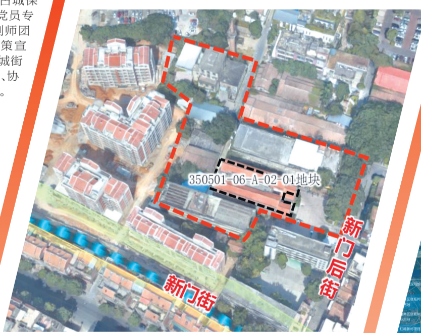
中侨大厦地块盘活后,焕新为古城西北门户复合型服务地标。