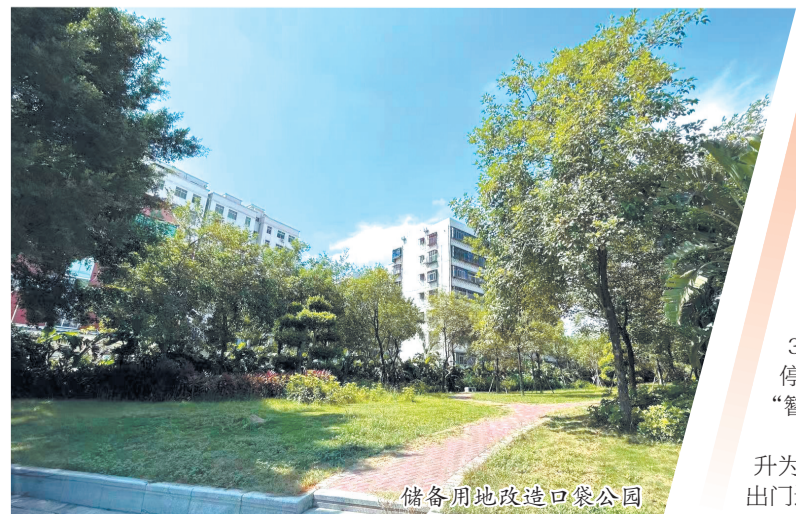
储备用地改造口袋公园

在高效收储的同时,市自然资源和规划局精准把控出让时序、优化出让结构,全力保障土地市场平稳健康运行。2025年累计完成土地出让56宗、面积2384.99亩,成交金额139.34亿元,为城市基础设施建设、民生事业发展提供了坚实支撑。