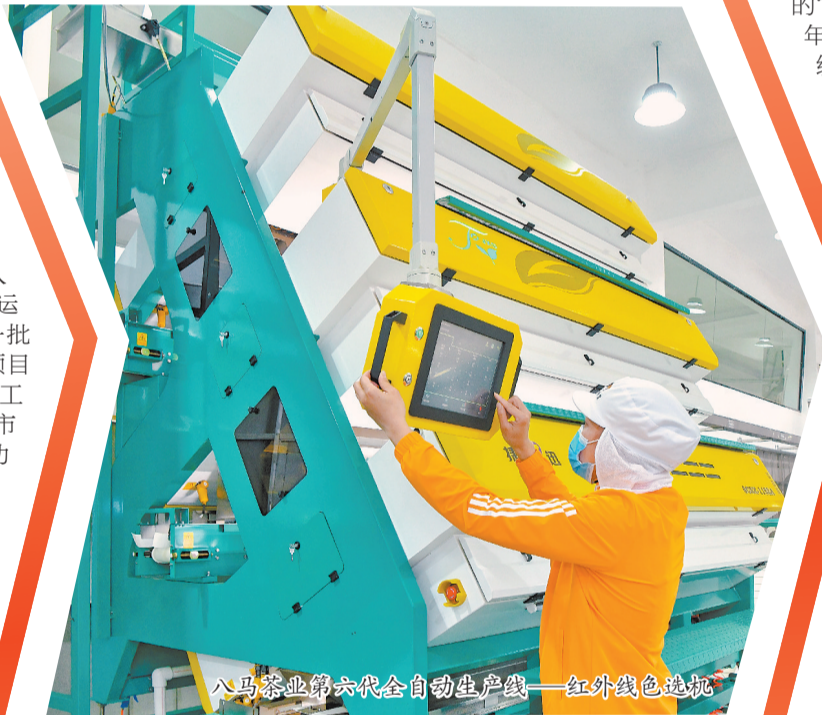
八马茶业第六代全自动生产线——红外线色选机

这座“会呼吸”的园区,是泉州制造业绿色转型的一个缩影。“降碳、减污、扩绿”已成为泉州制造业绿色变革的主旋律,去年,泉州交出了一份领跑全省的绿色答卷:泉州持续推动节能新工艺、新技术、新设备应用,引导重点行业、重点企业实施绿色低碳升级改造,绿色技改项目数量全省第一;新培育3家省级能效“领跑者”标杆企业,能效“领跑者”标杆数量全省第一,为同行业树立了可学可鉴的绿色典范;新培育安踏鞋材、百宏聚纤等61家省级绿色工厂,洛江经开区、安溪经开区等5个省级绿色工业园区,七匹狼、匹克等10家省级绿色供应链管理企业,绿色制造标杆数量全省第一。