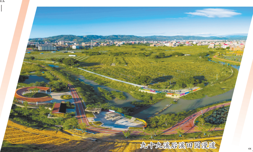
九十九溪后溪田园漫道