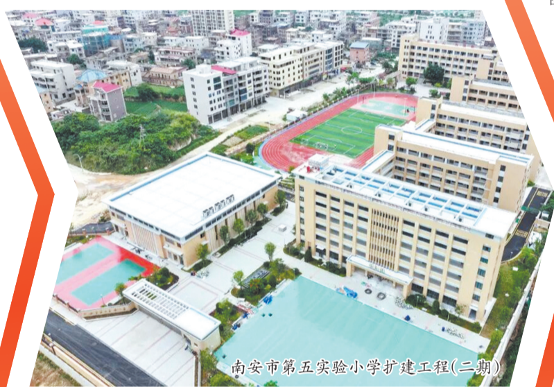
南安市第五实验小学扩建工程(二期)