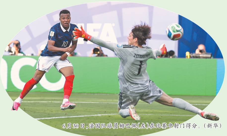
6月30日,法国队球员姆巴佩(左)在比赛中射门得分。

法国队直到第15分钟才由边后卫迪涅在禁区外远射完成第一次射门。但此后,“高卢雄鸡”逐渐掌握比赛节奏,瑞典门将