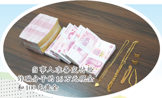
当事人准备交付给诈骗分子的16万元现金和100克黄金