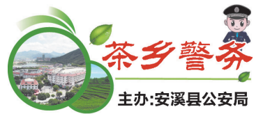
主办:安溪县公安局

作。日前,两名当事人因情感纠纷激烈争执,冲突一触即发。带教民警摒弃刻板生硬的说教,耐心倾听双方诉求,细致梳理矛盾根源,反复沟通劝解、协调疏导。最终双方冰释前嫌、握手言和。小小的纠纷调解案例,让实习生深刻领悟到,基层警务工作不仅需要法理支撑,更需要温度与沟通技巧。从校园课堂到基层一线,从书本理论到实战实践,这段宝贵的基层实习经历,成为警校学子青春成长路上最珍贵的一课。