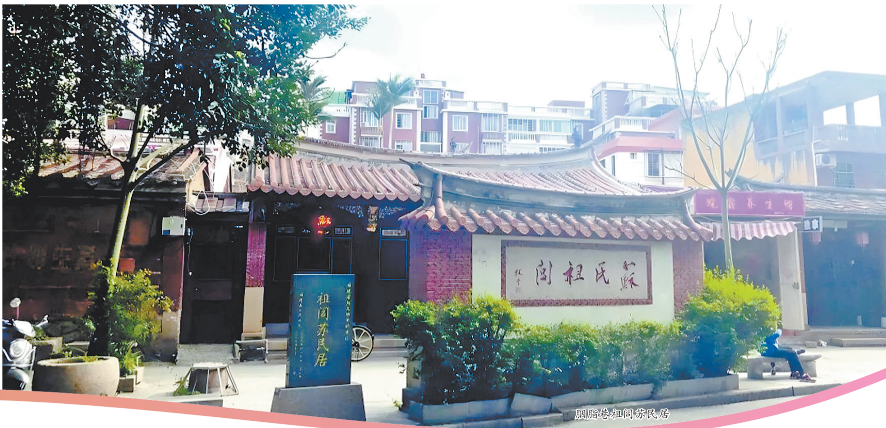
胭脂巷祖祠苏民居