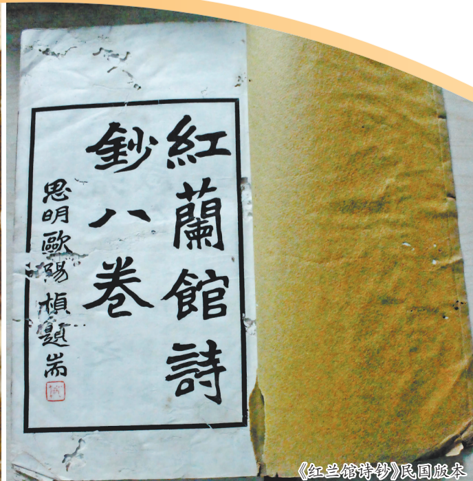
《紅蘭館詩鈔》民国版本