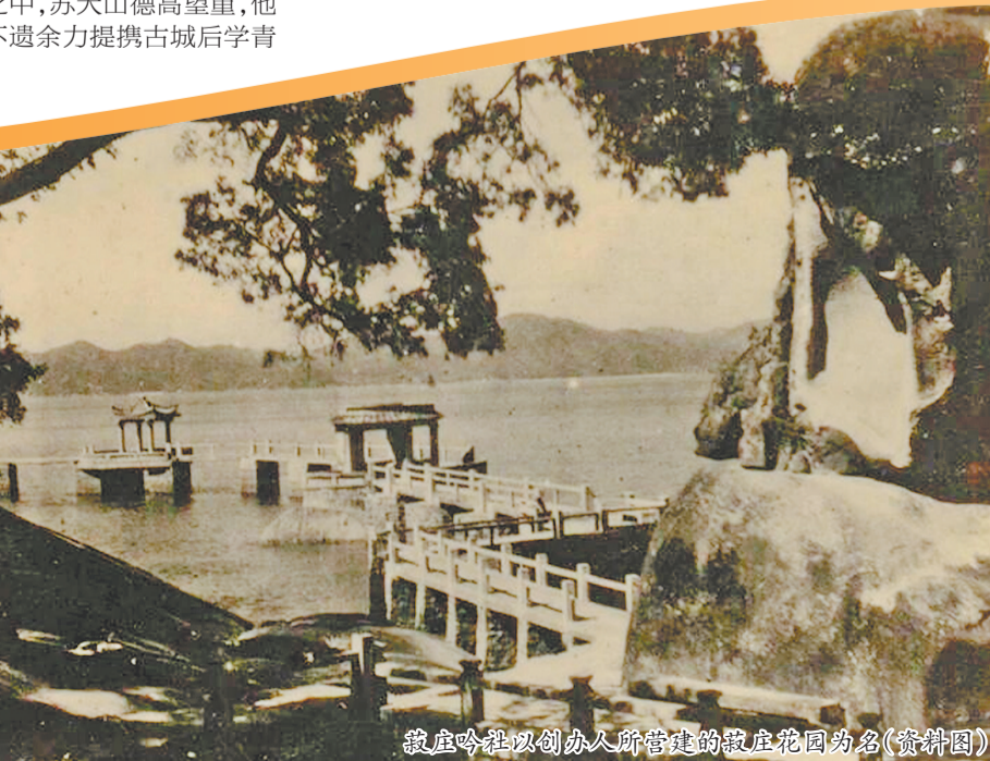
菽庄吟社以创办人所营建的菽庄花园为名(资料图)