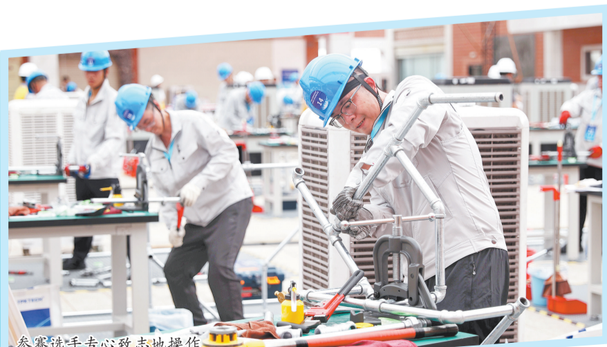
参赛选手专心致志地操作

本报讯(融媒体记者陈淑华 通讯员庄紫琳/文 陈起拓/图)7月1日至3日,2026年福建省住建系统管工职业技能竞赛在泉州举行。本次竞赛由省住建厅、省人社厅联合主办,省建设建材工会工作委员会、省城市建设协会承办。来自全省10个地市的22支代表队66名高水平选手以技会友、同台竞技,全面展示了我省住建系统职工的专业素养与实战能力。