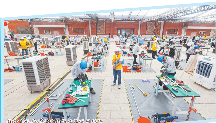
住建系统管工职业技能竞赛激烈进行