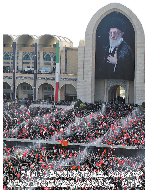
7月4日,在伊朗首都德黑兰,民众参加伊朗已故最高领袖葬礼公众告别仪式。(新华社)

据悉,哈梅内伊的长子、第三子与第四子均出席仪式。伊朗政府、军方官员以及部分外国代表团出席该仪式。伊朗革命卫队司令瓦希迪也出现在现场。(央视)