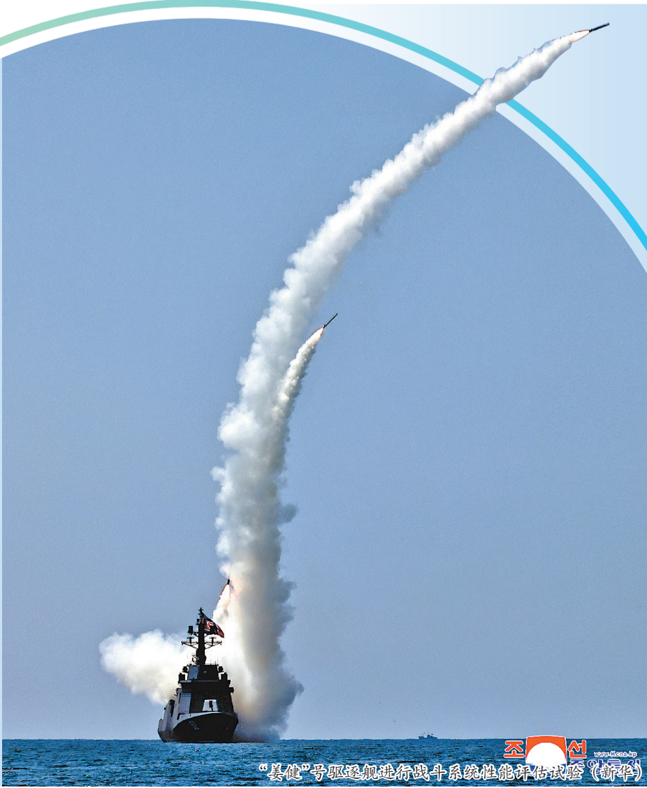
“姜健”号驱逐舰进行战斗系统性能评估试验

金正恩表示,朝鲜要持续大力推进维持并不断升级战争遏制力和战争执行能力。他要求,完成“姜健”号驱逐舰的试验程序后,两个月之内移交海军服役。