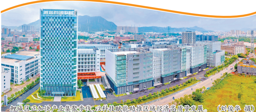
鲤城高新区正加快产业集聚步伐,以科技赋能助推区域经济高质量发展。

聚焦研发投入这一创新“硬指标”,通过专题调度与业务培训双管齐下,指导企业规范研发费用归集。针对新增纳统企业举办研发经费归集管理培训,重点解读税前加计扣除等惠企政策,激发企业研发积极性;同步引导企业参加研发管理提升高级研修班,提升研发管理精细化水平。目前,累计指导132家企业归集填报研发经费7.21亿元,比2025年归集填报数增长20.17%,创新“底盘”愈发坚实。同时,畅通政策兑现渠道,指导