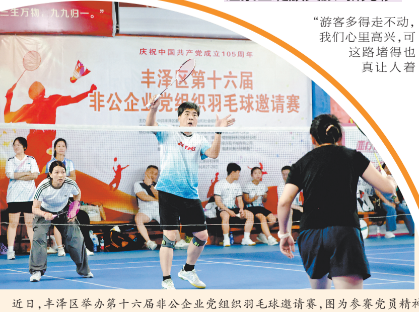
近日,丰泽区举办第十六届非公企业党组织羽毛球邀请赛,图为参赛党员精神饱满进行比赛。

从赋能数字经济的产业园区,到引爆全网的非遗景区,再到温情涌动的城市社区,“三区联创”如同一把“金钥匙”,在丰泽打开了区域资源整合、优势互补、协同发展的新格局。下一步,丰泽区将持续深耕“三区联创”,加快打造一批示范样板点,让“党建红”引领“发展潮”,让“合力”化为“民生暖”,努力绘就全域融合、全民共享的崭新画卷。(丰宣)