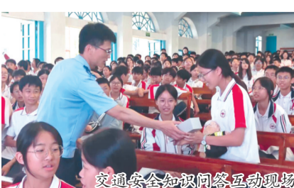
交通安全知识问答互动现场

程中,民警精准聚焦学生日常出行高频危险行为,逐一细致讲解各类重点交通隐患。针对青少年热衷的摩托车、电动车“飙车炸街”行为,民警结合辖区查处的真实案例,讲明该行为不仅扰乱公共秩序,更极易引发严重交通事故,触犯法律法规,付出沉重代价。同时,民警重点剖析学生出行常见的交通陋习,详细讲解逆向行驶、骑行不佩戴安全头盔、随意横穿马路、车辆违规载人、未成年人酒醉驾等危险行为的安全隐患与法律后果。活动现场通过交通安全知识有奖问答互动,提升宣讲趣味性和实效性。