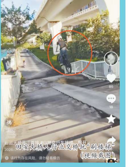
南安大桥人行立交桥上“刷楼梯”(视频截图)