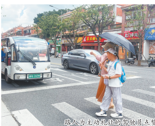
路人为主动礼让的驾驶员点赞

聚焦“礼让斑马线、规范靠站停”两大核心环节,开展高频次、全覆盖的路面督导。截至6月底,累计检查公交车2371辆次,记录违规驾驶行为153次。对发现的问题,坚持“发现一起、核查一起、闭环一起”,逐一销号,确保整改落到实处。