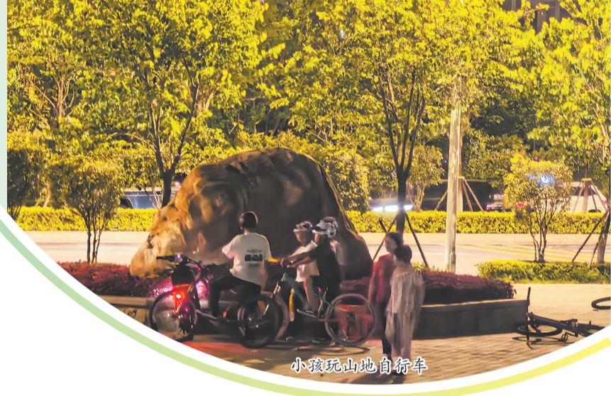
小孩玩山地自行车