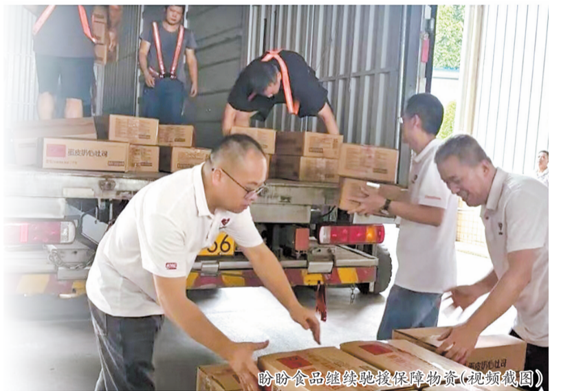
盼盼食品继续驰援保障物资(视频截图)

的洪灾,南宁泉州商会迅速响应,7月7日第一时间向全体会员发出抗洪救灾捐款倡议书,号召大家发扬闽南人“崇德向善、乐善好施”的传统美德,伸出援手为灾区群众送去温暖和希望。倡议一出,应者如云。截至7月9日10点,57名会员踊跃奉献爱心,捐款71700元,商会及时将爱心善款交付救灾机构采购物资,缓解灾区人民燃眉之急。还有不少会员企业、乡贤自发通过其他公益渠道捐款,金额合计33500元,一股股暖流汇聚成抗洪救灾的强大力量。